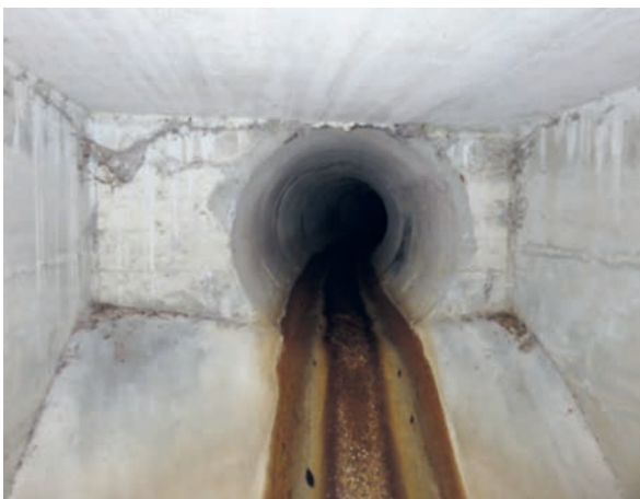
Der Durchlass der Bachröhre ist für ein Hochwasser zu klein.

Im Jahr 2019 hat der Gemeinderat verschiedentlich informiert, dass die Röhre des Schwarzenbachs zwischen der Jonschwiler- und der Bach-/Aeuelistrasse angepasst werden muss. Der Gemeinderat beantragt der Bürgerversammlung vom 30. März 2020 mit einem Gutachten einen Kredit von Fr. 715 000 zur Sanierung des Bachdurchlasses. Mit dem Projekt wird der Hochwasserschutz beim Schwarzenbach deutlich verbessert. Die Bachstrecke zwischen der Jonschwilerstrasse und der Bach-/Aeuelistrasse soll teilweise geöffnet werden. Diejenige Bachstrecke, welche aufgrund der Platzverhältnisse nicht geöffnet werden kann, soll einen grösser dimensionierten Durchlass erhalten. Das Projekt soll im Jahr 2020 umgesetzt werden, damit anschliessend die geänderten Verkehrsführungen im Umfeld der Schule Schwarzenbach realisiert werden können.