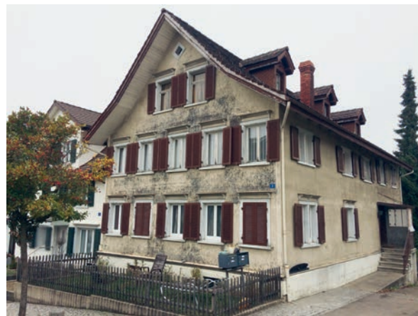
An diesem Gebäude werden Sanierungsarbeiten ausgeführt.

Die Gemeinde Jonschwil hat im Jahr 2019 die Liegenschaft Kronenstrasse 3 im Dorfczentrum von Jonschwil erworben. Nachdem die Mieter gekündigt haben, hat der Gemeinderat beschlossen, so bald als möglich einige Instandstellungsarbeiten ausführen zu lassen (Heizung, sanitäre Einrichtungen, Böden, Warmwasser, diverse Reparaturen). Der Gemeinderat hat dafür einen Kredit von Fr. 95 000 gesprochen. Damit kann das Gebäude vorderhand wieder zu Wohnzwecken genutzt werden und es resultiert ein Mietertrag. Die längerfristige Nutzung des Gebäudes ist noch offen.