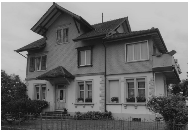
Stickerhaus an der Jonschwilerstrasse in Schwarzenbach (ehemaliges Restaurant Rose), nach rechts erweitert und dann aufgestockt.

Die grösseren Maschinen, die Stoffspannweite war mittlerweile auf 10 Yard gestiegen und es wurde auf zwei übereinanderstehenden Stoffbahnen gestickt, verlangten auch bauliche Anpassungen. Die Häuser waren zu schmal und die Raumhöhe zu gering. So musste meist das Haus im Erdgeschoss nach einer Seite erweitert und die Raumhöhe durch Tiefergraben erhöht werden. Diese Stickerhäuser des 20. Jahrhunderts sind im Dorfbild immer noch leicht zu erkennen.