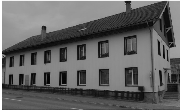
Ältestes Fabrikgebäude in Jonschwil

Da die Gehaltsverhältnisse der Beamten und Angestellten damals sehr bescheiden waren und allein nicht hinreichten für den Unterhalt einer auch nur kleinen Familie, entschloss sich der Vater der aufblühenden Maschinenindustrie sich hinzuwenden und kaufte mit einem Verwandten, der Sticker war, drei Maschinen, sie waren die ersten Besitzer von Stickmaschinen in der Gemeinde Jonschwil. 1870 beteiligte sich der Vater auch an einer Aktiengesellschaft, welche den Bau einer Stickerei mit 12 Maschinen ausführte. Mein Vater wurde Geschäftsführer, was zur Folge hatte, dass auch ich in diese Industrie eingeführt wurde, und zwar nicht nur in den kaufmännischen, sondern auch in den technischen Betrieb derselben, indem ich als 18jähriger Jüngling das Sticken erlernen musste.