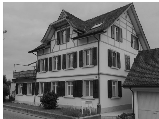
Stickerhaus an der Winkelstrasse Jonschwil

In den 70er-Jahren trat eine Krise ein und der Verband zahlte den Stickern Prämien, wenn sie ihre (meist in die Jahre gekommenen) Maschinen abrechnen liessen und verkauften. Im Jahr 2002 stellte dann mit der Stickerei Keller auch der letzte Textilbetrieb in der Gemeinde seinen Dienst ein.