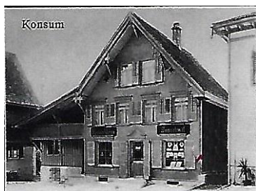
Erstes Jonschwil Postbureau an der Lütisburgerstr. 2