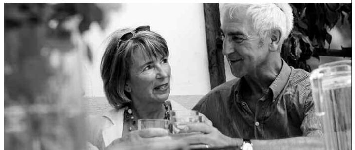
Entspannt in die zweite Lebenshälfte: Wer heute richtig plant, hat morgen mehr.

ST.GALLEN Es lohnt sich, rechtzeitig mit der Planung der Pensionierung zu beginnen. Ganz besonders gilt dies für eine Frühpensionierung. Viele Fragen sind damit verbunden. Die kompetenten Antworten darauf gibt Ihnen «Vivanti», das neue Leistungspaket der St.Galler Kantonalbank, mit dem Sie entspannt in die zweite Lebenshälfte blicken können.