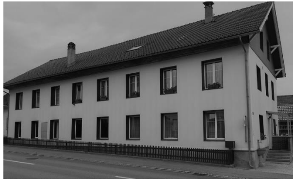
Ältestes Fabrikgebäude in Jonschwil