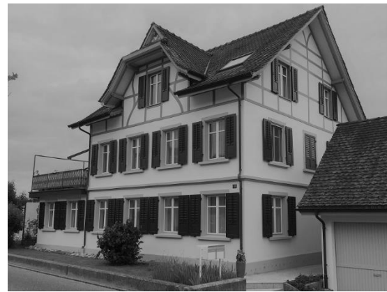
Stickerhaus an der Winkelstrasse Jonschwil

In den 70er-Jahren trat eine Krise ein und der Verband zahlte den Stickern Prämien, wenn sie ihre (meist in die Jahre gekommenen) Maschinen abrechnen liessen und verkauften. Im Jahr 2002 stellte dann mit der Stickerei Keller auch der letzte Textilbetrieb in der Gemeinde seinen Dienst ein.