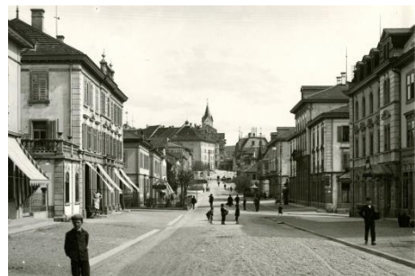
Obere Bahnhofstrasse Wil zu Beginn des 20. Jahrhunderts