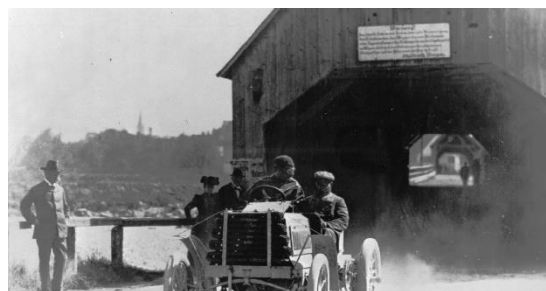
Farman und sein Mechaniker auf einem Panhard bei den Rheinbrücken in der Nähe von Bregenz

Eine Momentaufnahme des Rennens 7 Kilometer von Bregenz. Hinter einander drei Wagen, die Vorsprung à tout prix erjagen wollen. Der mittlere biegt aus, um vorzufahren, der hintere schliesst sich sofort dem ersten an, und nun der mittlere: im Bogen rast er hinein bis zur Hälfte im Graben, schräg liegt der Wagen, schräg hängen die Fahrer darin, aber sie rasen weiter, ob auch der Schlamm spritzt, und im günstigen Momente erklettern sie wieder die Böschung, erjagen den Vorsprung und weiter geht's dem nächsten nach.