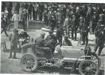
Baron de Knyff an der Kontrollstelle in St. Gallen

Gottlob, dass sie vorbei ist, die wilde, verwegene, unsinnige Jagd!