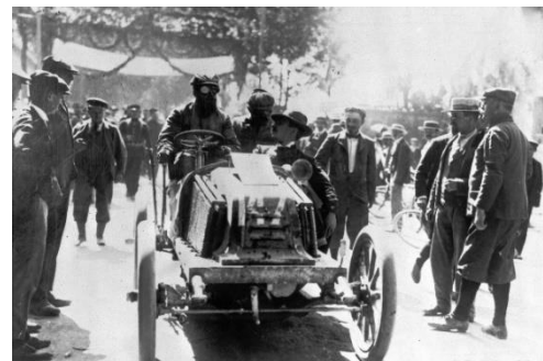
Sieger Marcel Renault mit Wagen Nr. 147

Marcel Renault kam dann im folgenden Jahr beim Rennen Paris – Madrid ums Leben, und weil noch vier andere Fahrer und drei Zuschauer das gleiche Schicksal erlitten, wurde jenes Rennen in Bordeaux abgebrochen. Die französischen Behörden verboten solche Fernfahrtrennen, womit sich der Automobilsport auf Rundrennen beschränken musste.