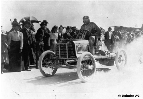
Überall grosse Zuschauermengen entlang der Rennstrecke.

Jedenfalls kommen die Fahrer eher auf die Rechnung als die Neugier der Zuschauer. Die Geduld dieser letzteren wurde zeitweise auf eine harte Probe gestellt und viele, die aus ziemlich weiter Ferne an die Route geeilt waren, bekamen herzlich wenig zu sehen. Sie rechneten eben nicht mit der Raschheit dieser modernen Vehikel und – mit der Ungenauigkeit der Berichterstattung. ... Denn erst um 2 ¼ Uhr sausten die ersten Gefährte bei drückender Hitze und unter enormer Staubaufwirbelung durch die Stadt.