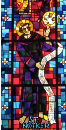
Chorfenster in der Jonschwiler Martinskirche.

Am 6. April 912 starb im Kloster St. Gallen Notker Balbulus (der Stammler). Sein Jonschwiler Ursprung ist nicht gänzlich gesichert, aber sehr wahrscheinlich.