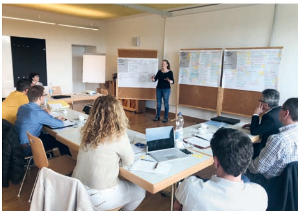
Der Gemeinderat am Strategietag im Schulhaus Sonnenrain, Jonschwil

Im Rahmen einer Zukunftswerkstatt ist die Bevölkerung eingeladen, die vom Gemeinderat entworfene Stossrichtung für die Ortsplanung zu diskutieren und eigene Vorschläge einzubringen. Der Anlass findet am Donnerstag, 20. Juni 2019, um 19.00 Uhr in der Aula des Oberstufenzentrums Degenau statt.