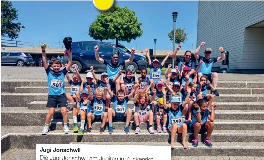
Jugi Jonschwil Die Jugi Jonschwil am Jugitag in Zuckenriet.