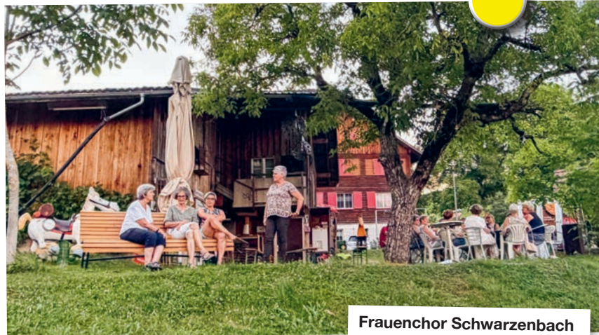
Frauenchor Schwarzenbach Fröhlicher Sommeranlass bei der Burepizza Gähwil unter den Bäumen.