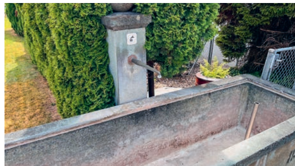
Dem Dorfbrunnen an der Wilerstrasse ist das Wasser ausgegangen!

Dorfkorporationen Jonschwil und Schwarzenbach & Gruppe Wasserversorgung Vogelsberg (GWV)