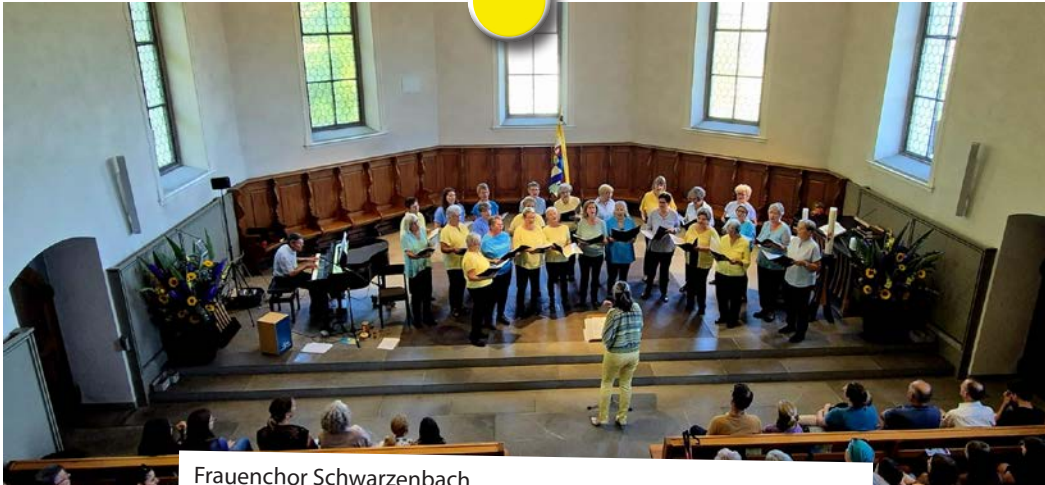
Frauenchor Schwarzenbach Summer Breeze Mit zwei zauberhaften Sommerkonzerten in Oberuzwil und Henau am 13. und 14. Juni erfreuten wir ein grosses Publikum.