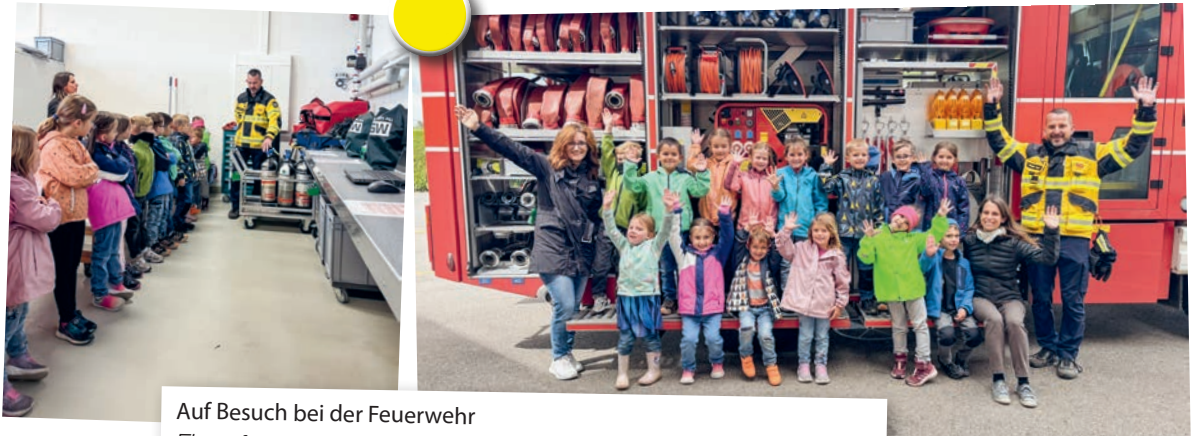
Auf Besuch bei der Feuerwehr Ein aufregender Blick hinter die Kulissen: Eine Kindergartenklasse besuchte die Feuerwehr Jonschwil.