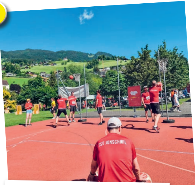
TSV Jonschwil Voller Einsatz! Die Aktivriege des TSV Jonschwil am Sportfest in Sarnen.