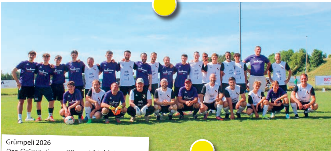
Grümpeli 2026 Das Grümpeli vom 30. und 31. Mai 2026 bot einmal mehr beste Unterhaltung, spannende Spiele und Fussballbegeisterung.