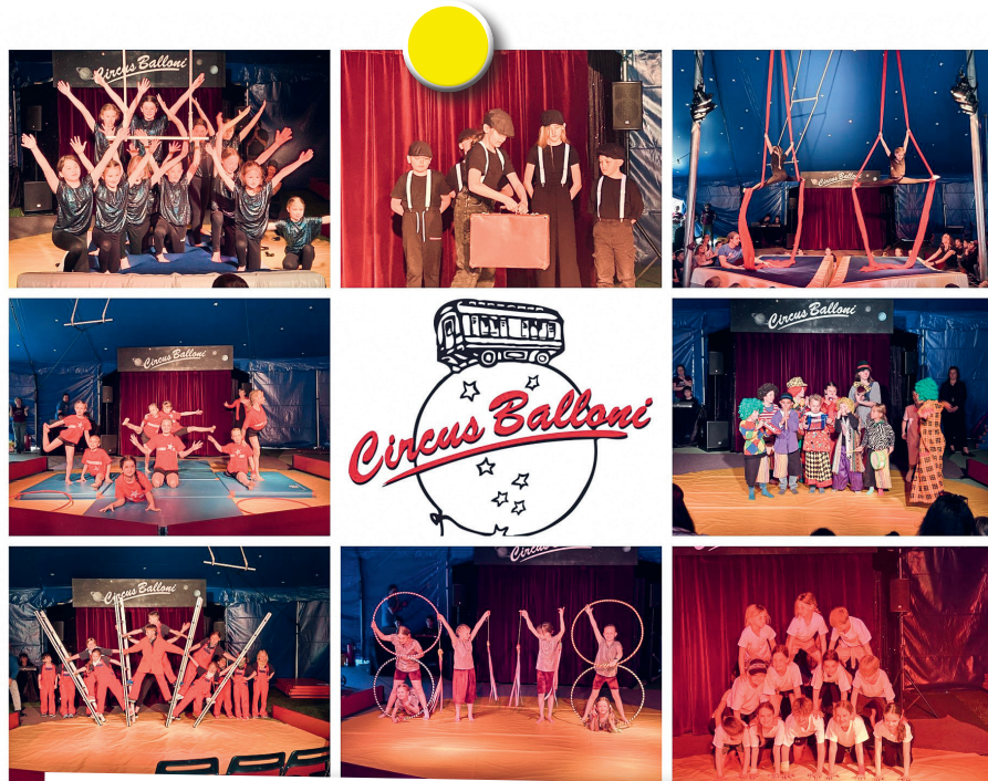
Primarschulen Jonschwil-Schwarzenbach Zirkus Balloni in Jonschwil und Schwarzenbach