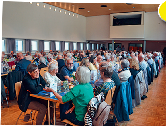
Spitex Regio Uzwil Mitgliederversammlung vom 29. April 2026 in Niederbüren.