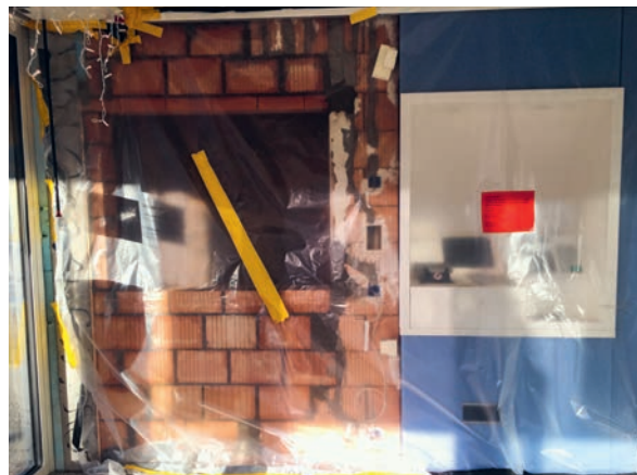
Es dauert einige Wochen, bis ein neuer Bancomat geliefert wird.

Kurz vor Weihnachten wurde der Bancomat der Raiffeisenbank Schwarzenbach gesprengt. Dies hat zur Folge, dass für mehrere Wochen keine (automatischen) Bargeld-Bezüge und auch keine (automatischen) Geldeinzahlungen mehr möglich sind. Die Raiffeisenbank hofft, den Bancomaten Ende Februar 2020 wieder in Betrieb nehmen zu können. Die Bank bittet die Bevölkerung, Bancomaten in der Region zu benutzen oder Bargeldgeschäfte am Bankschalter zu den Öffnungszeiten abzuwickeln.